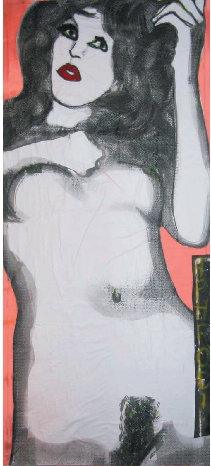
aphrodite (200cm x 90cm)