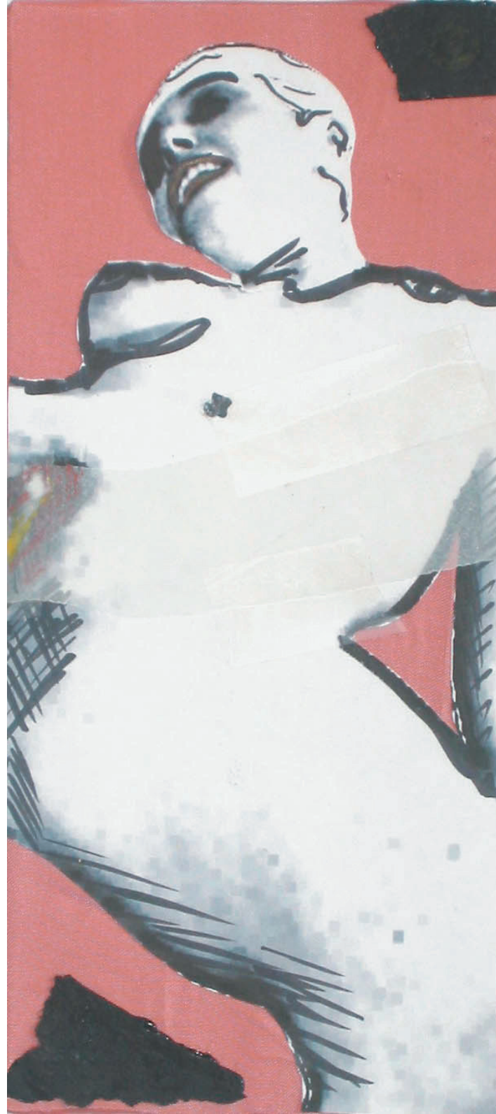
kalypso (200cm x 90cm)