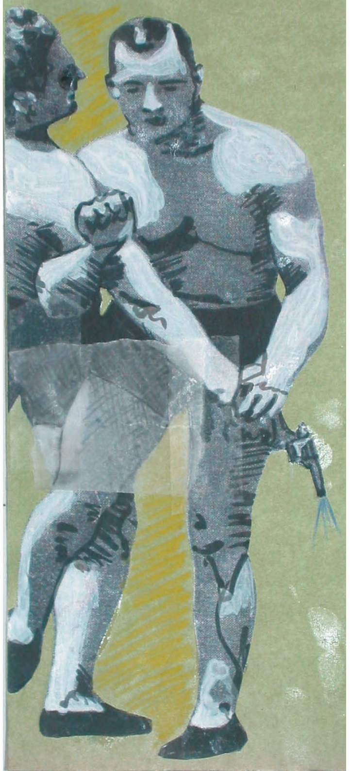
revolverangriff (200cm x 90 cm)