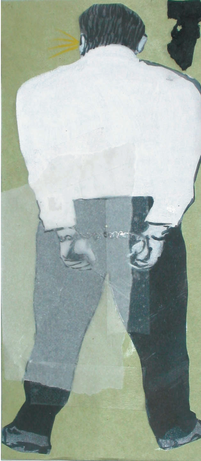
die rückenfesselung (200cm x 90cm)