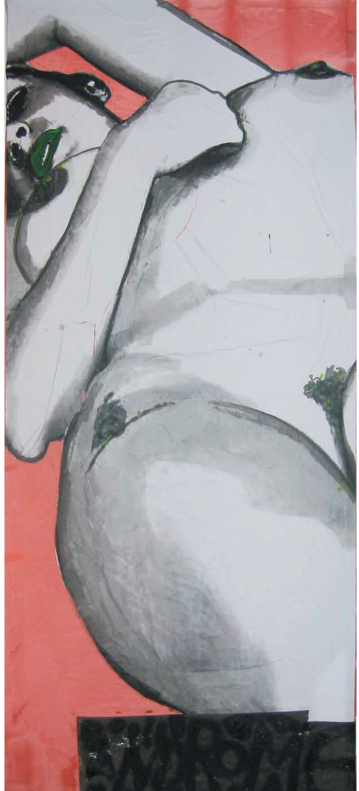
andromeda (200cm x 90cm)