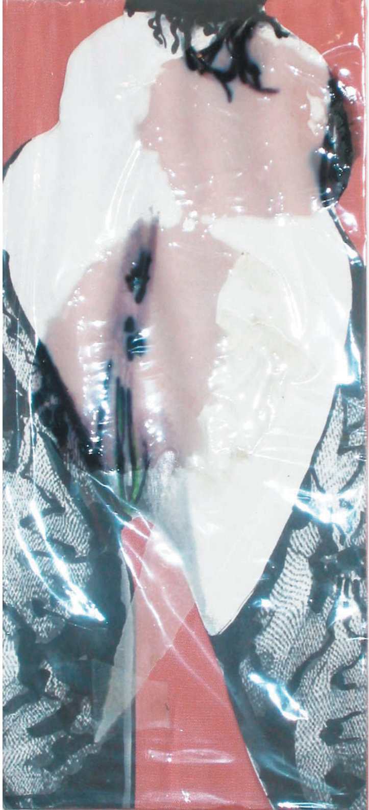
thetis (200cm x 90cm)