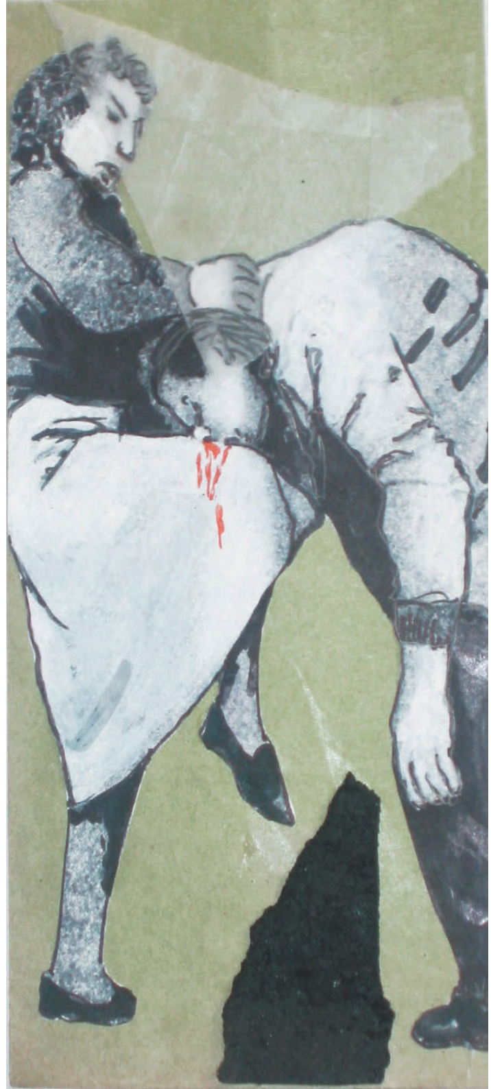
lästiger angreifer (200cm x 90cm)