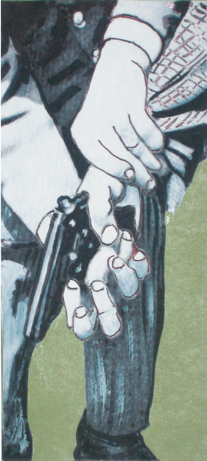
am abzug (200cm x 90cm)