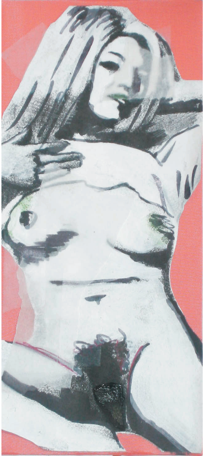
flora (200cm x 90cm)