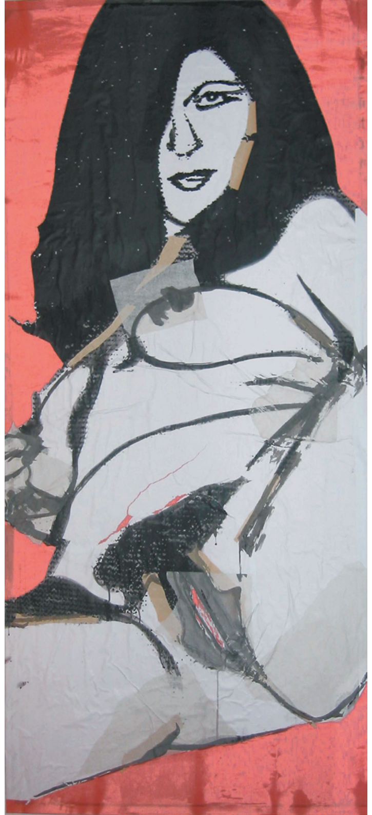
pasiphae (200cm x 90 cm)