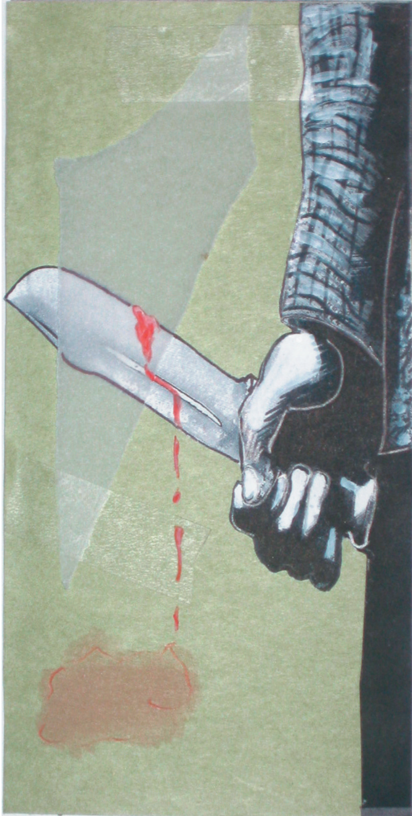
die leberpastete (200cm x 90cm)