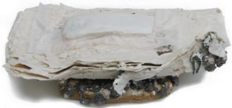
weiße blätter, 2006 mischton, 1250° c, porzellan, japanpapier, eisen, pigment; maße: 32cm x 14cm x 8cm