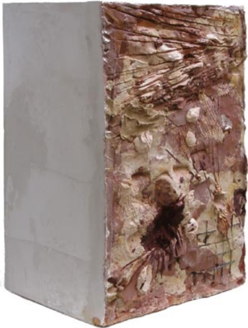
„weißer balken mit rinde“ 2006; mischton 1050° C, gips; maße 58cmx37cmx30cm;