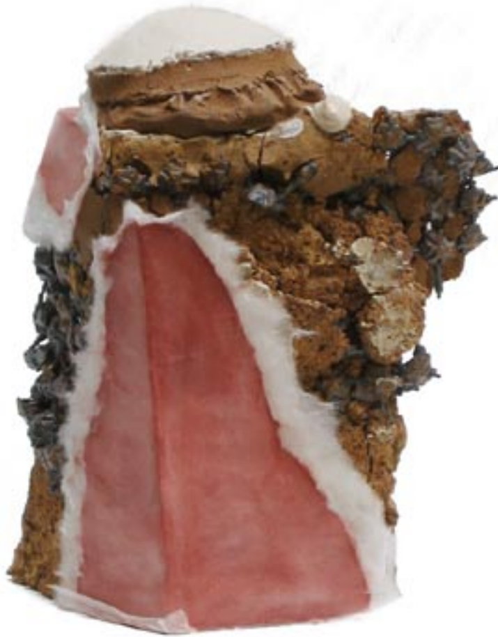
korrodierende architektur, 2006 mischton, 1250° c, porzellan, japanpapier, eisen, pigment: maße: 35cm x 13cm x 16cm